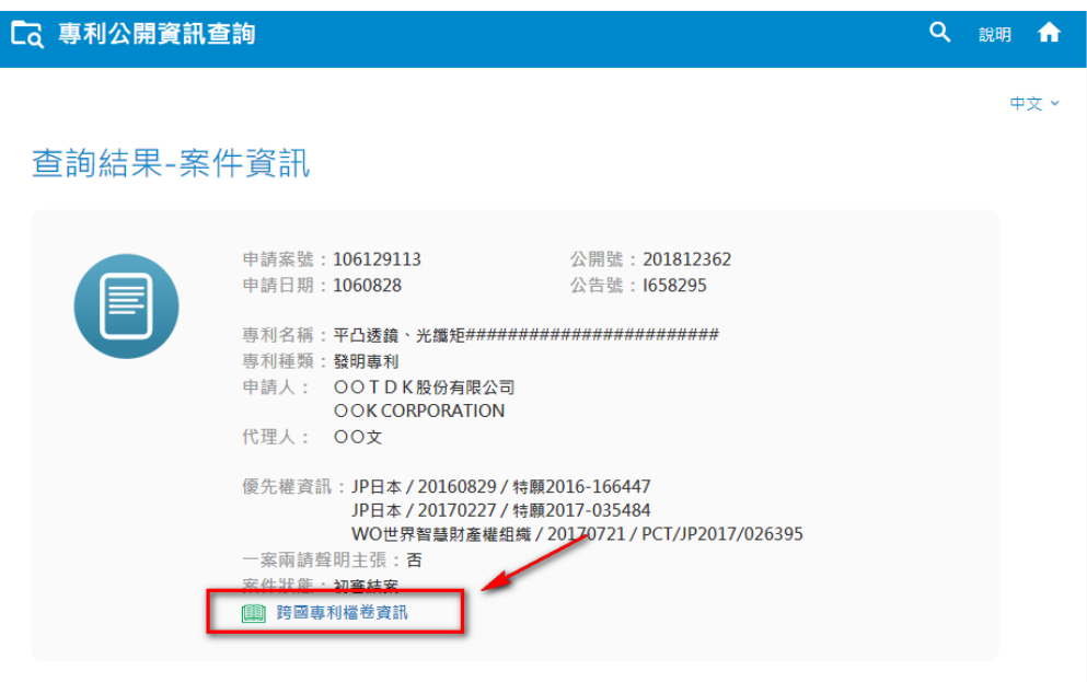
(上圖:點擊跨國專利檔卷資訊連結)